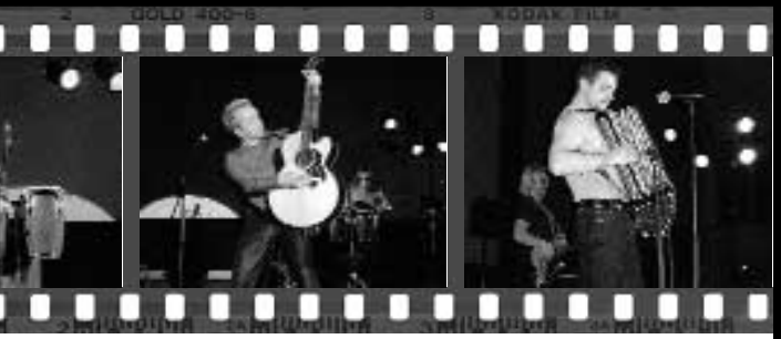
Интервью взяла Мария Чернобровина

авторитетом вводить в те сферы, которые до этого были закрыты. О предназначении. Моё предназначение — служить Богу. А что такое служить Богу? Это слушать людям. В последнее время я стал понимать, что не люди для «Нового Иерусалима», а «Новый Иерусалим» для людей, что не люди для Церкви, а Церковь на этой земле для людей, что не люди для Иисуса, а Иисус пришел на землю для людей, чтобы спасти их. В общем, все в этой жизни крутится вокруг человека. Потому что Бог любит человека. В конце концов, не коров же и бычков Ему спасать. Души людей — бесценны. Он приготовил для нас Небеса, когда жизнь на этой земле пройдет».