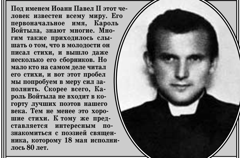
Кароль Войтыла. Варшава, 1945 г.

17 МАЯ экспедиция краснодарского клуба «Экстем» совершила восхождение на вершину Эвереста. В составе группы было 10 восходителей и 10 человек из группы сопровождения. Основной спонсор экспедиции: Краснодарский юридический институт МВД России. Маршрут команды был следующим: по Северо-Восточному гребню, через Северное седло со стороны Тибета. Путешествие было приурочено к 2000-летию христианства и... 200-летию МВД. Они оставили икону Божьей матери на самой высокой вершине мира. Альпинисты известны преданностью своему хобби. Их посвящению ины христиане могут только позавидовать. Они живут от восхождения к восхождению, их связывает крепкая дружба. Они уважают опыт и мужество своих лидеров, а те пекут новичков с любовью и посвящением. У них есть свои песни и своя этика. Их связывают «всекие взаимоскрепляющие связи», то есть все, как должно быть в церкви. Так, по крайней мере, знаем мы их по фильмам, книгам и рассказам. Им можно было позавидовать, если бы не одно «но» — у них нет Христа. Но какие-то религиозные убеждения у них, возможно, есть. Мы не беремся судить о силе и истинности веры этих людей и не знаем, какие причины побудили их вместе с собой лик Богородицы на Эверест. Возможно, они надеялись, что