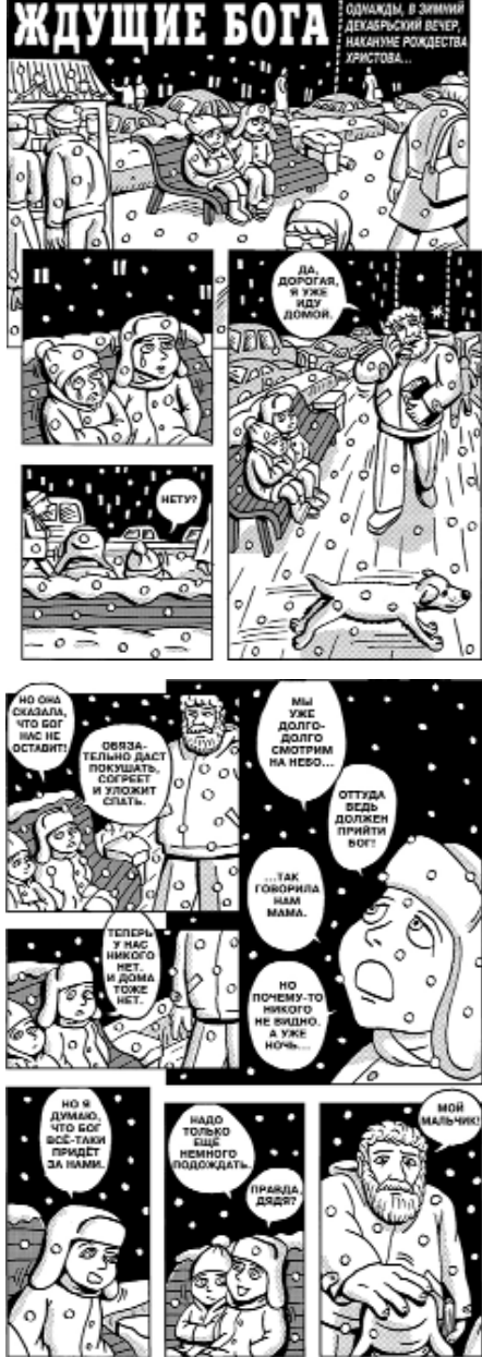
ГРАФИЧЕСКАЯ НОВЕЛЛА ИГОРЯ КОЛГАРЕВА