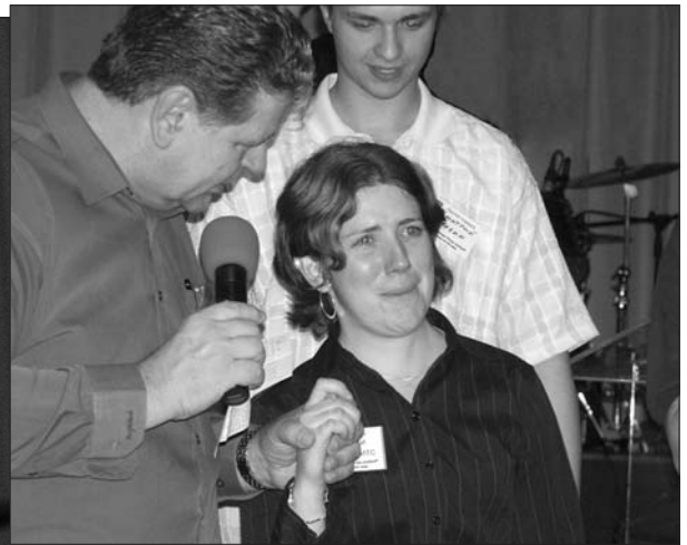
справа: на кон- ферен- ции «Любовь Отца»